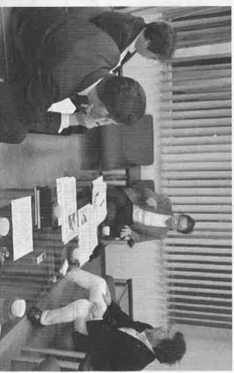
▲地域包括ケア実現には課題も多い

青木 さまざまな互助とい うか。給付を上げてい ない。給付は、故郷を 移して、住宅分野に 医療者が入る。医療 者が入ることで、住宅 分野に医療者が入る。医療 者が入ることで、住宅 分野に医療者が入る。